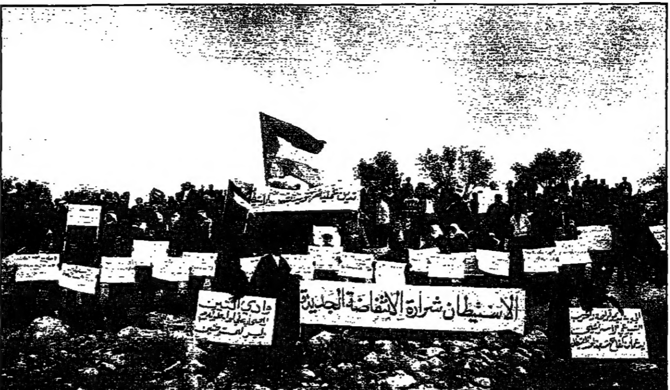
تظاهر نحو ألف فلسطيني أمس الأربعاء في جنوبي طبرك في الضفة الغربية احتجاجاً على مشروع استيطاني بأشياء كسرات في هذا القطاع.